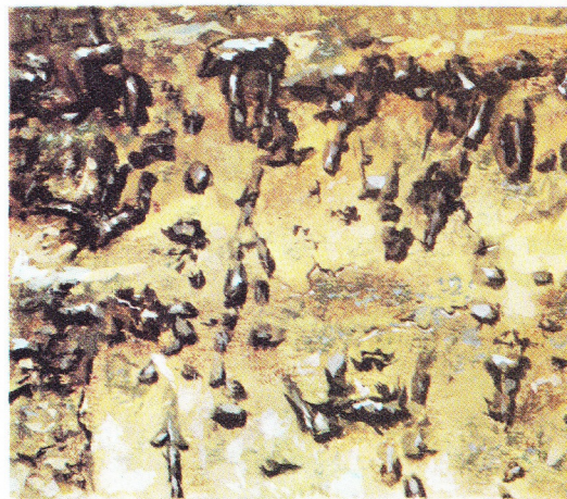
versteende wortels bewijzen dat de woestijn minder schraal is geweest

derlandse naam kregen zij van de Boeren, die hun taal niet verstonden en de bevolking naar de stotende klanken die zij uitbrachten, "Hottentotten" noemden. Deze inboorlingen zijn enigszins verwant met de bosjesmannen, al zijn ze wel iets groter. Zij hebben geen vaste woonplaats en ze houden zich vooral met het kweken van runderen en schapen bezig.